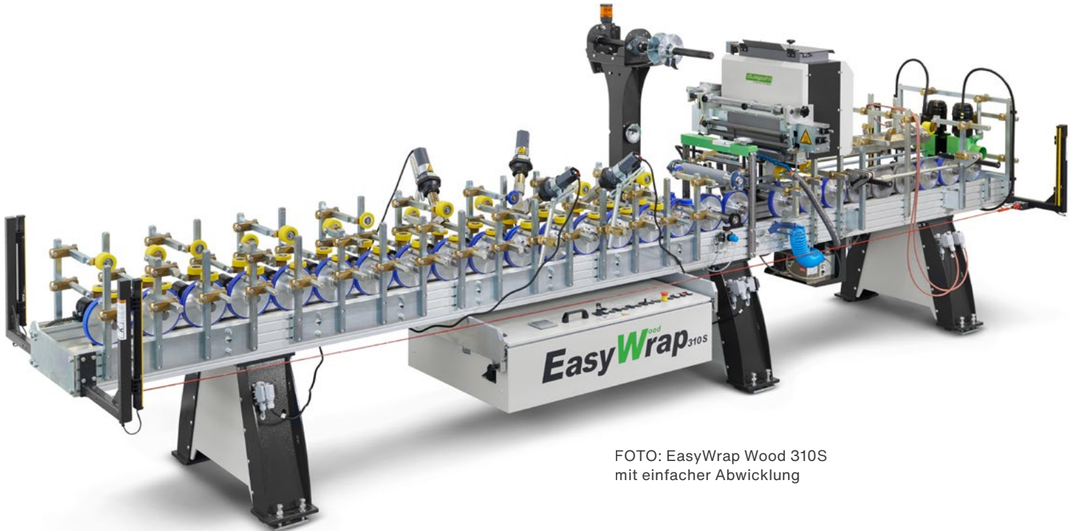
FOTO: EasyWrap Wood 310S mit einfacher Abwicklung