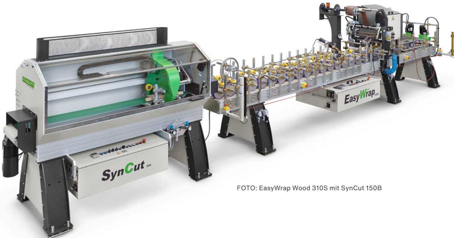
FOTO: EasyWrap Wood 310S mit SynCut 150B